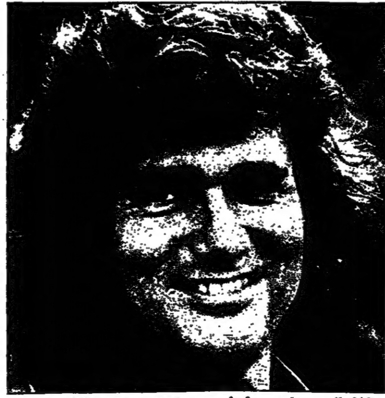
مايكل لندن - نجم مسلسل «بيت صغير في القفر»

بيت صغير في القفر الغزيرون كاري الغزيرون كاري الغزيرون كاري الغزيرون كاري